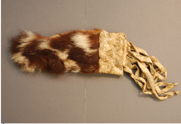
Figura 1 – Fotografía de un estuche de cuero de jaguar para guardar la cuchilla de hueso

últimos de la cadena del almacenamiento, guardan gran variedad de elementos orgánicos e inorgánicos de diferentes tamaños y formas.