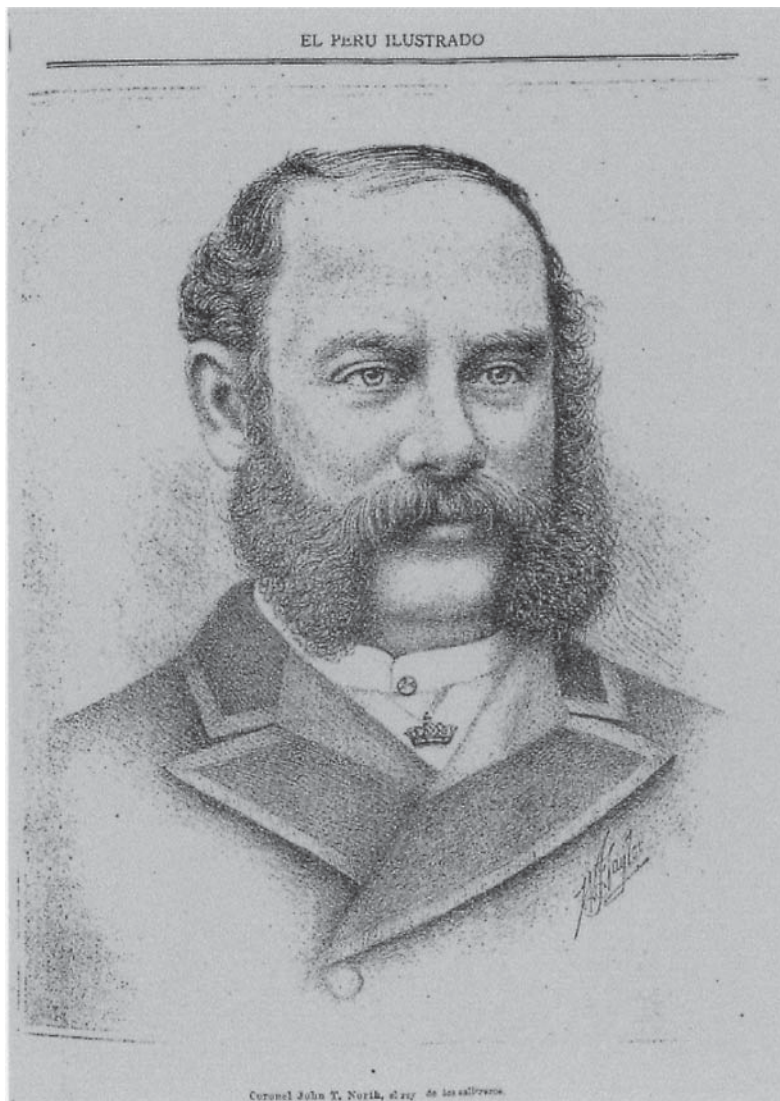
Fig. 3 - n° 106, 18 de mayo de 1889.

de comunicación, la carencia de las cuales será la rémora que por mucho tiempo aún se opondrá a nuestro adelanto y a ese bienestar que hoy no es más que dorada ilusión” ( El Perú Ilustrado , n° 42, 25 de mayo de 1888).