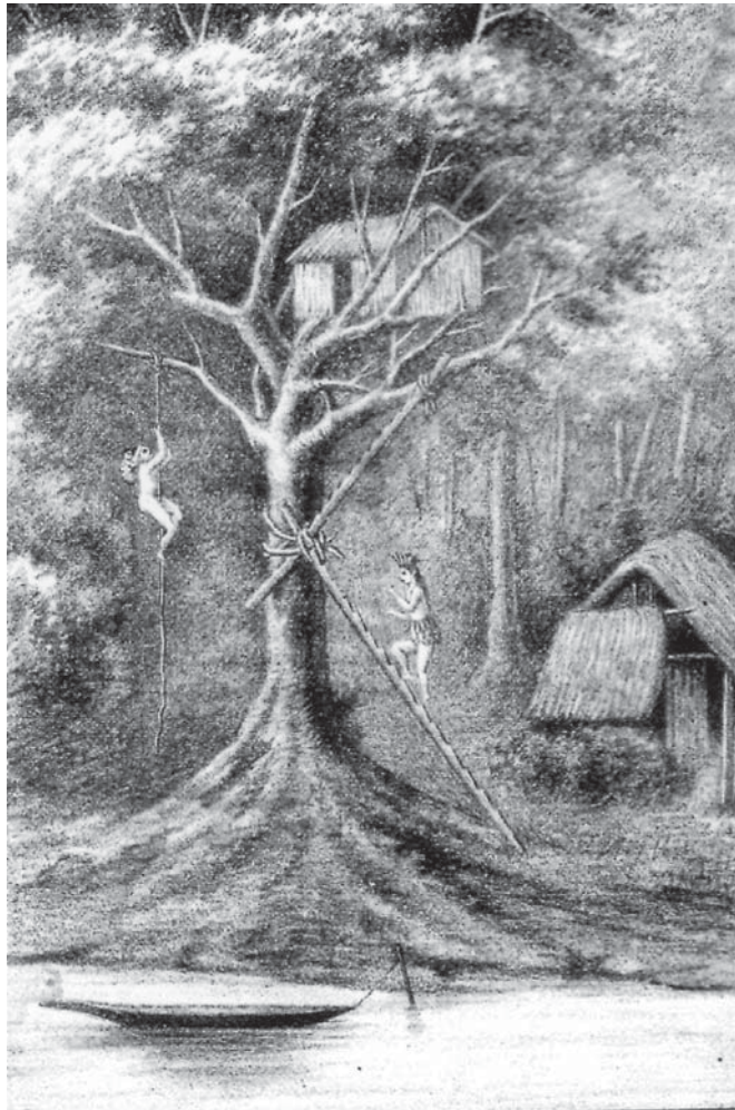
Fig. 4 - El Perú Ilustrado, n° 112, 29 de junio de 1889.

Tal serie de imágenes tiene como única perspectiva la conquista de los territorios orientales del Perú descuidados por las autoridades públicas. La pérdida de las provincias salitreras ha de ser compensada con el descubrimiento del nuevo El Dorado,