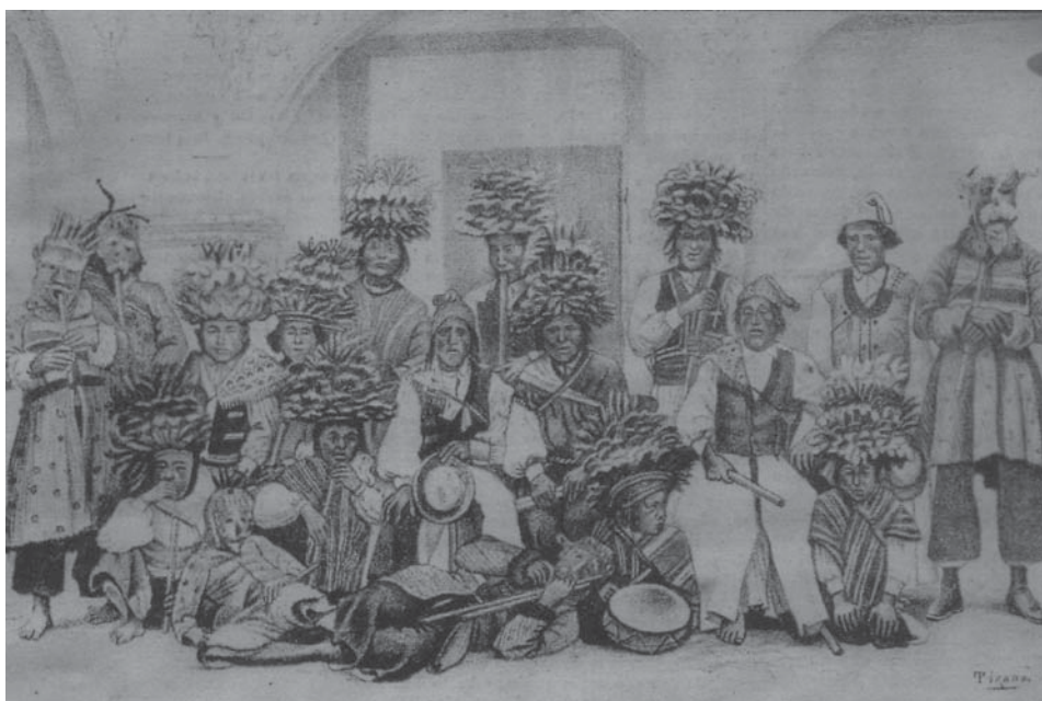
Fig. 5 - El Perú Ilustrado , n° 127, 12 de octubre de 1889.

La representación de las comunidades andinas conlleva el mismo exotismo pero carece por completo de todo tipo de estímulo. El rostro de un grupo de bailarines bolivianos con trajes emplumados refleja la degeneración de la raza (Fig. 5). El comentario se limita a criticar el alcoholismo y el mal gusto de las fiestas. Al abordar así estos temas, sólo se puede llegar a una conclusión: el indio es un ser repugnante y degenerado, sea el de la Amazonía o el de los Andes, y por ende, condenado a figurar sistemáticamente en la última página (23). Lo mismo sucede con las personas modestas de las ciudades, dibujadas siempre de manera caricaturesca como el deforme cochero limeño ( El Perú Ilustrado , n° 4, 4 de junio de 1887), o el tamalero montado en innoble burro ( El Perú Ilustrado , n° 7, 25 de junio de 1887). La simplificación y a veces el exceso caracterizan esos dibujos tan diferentes de los cuidadosos retratos de la primera plana consagrados a las personas célebres, modelos para todo el país. De forma casi imperceptible El Perú Ilustrado establece una jerarquía marginalizando a la inmensa