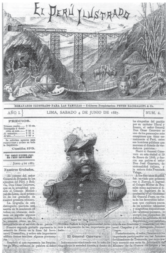
Fig. 1 - El Perú Ilustrado , n° 4, 4 de junio de 1887.

El juego de las proporciones, la inexactitud de la perspectiva, la pequeñez del indio que a pesar de estar en el primer término no es más que un monigote, son elementos que revelan las perspectivas ideológicas de los fundadores de El Perú Ilustrado , que no eran sino las de la clase dirigente. Los lamentables ceramios antropomorfos, la rústica cabaña, las frágiles llamas que sólo pueden cargar unos exiguos bultos, en fin, todo lo