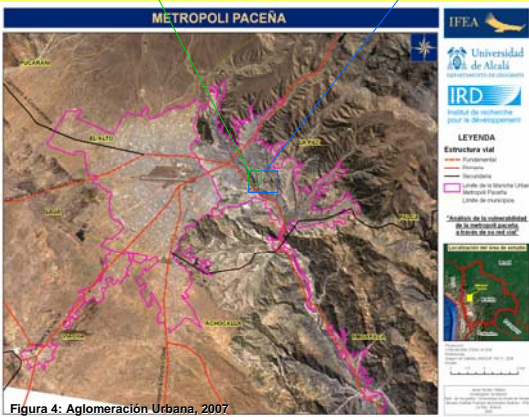
Figura 4: Aglomeración Urbana, 2007